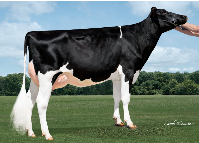
娘：ティマー ジョスーパー A ゴーリー ET

父 牛 シーガルベイ スーパーサイアー ET 母 牛 ユッカー ビーコン ジョイフリー ET 6-00 2x365日 M 16,565kg 3.9% F 639kg 3.0% P 503kg 母の父 エンドロード ビーコン ET 祖母の父 ジャンゴ ET