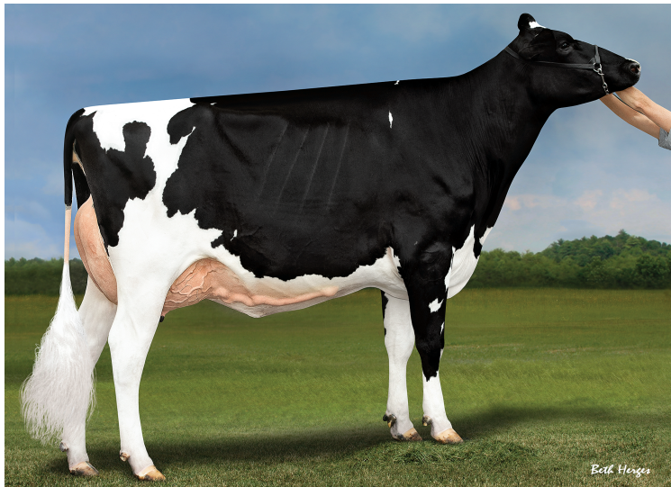
娘：ブラックブルック ハーベスト カラ

父 牛 ビューホーム モントレー ET 母 牛 ウィルラ ウノ 497 ET 6-01 3x305日 M 14,492kg 4.4% F 641kg 3.3% P 479kg 母の父 アミゲッティ ヌメロ ウノ ET 祖母の父 エンセナダ タブー プラネット ET