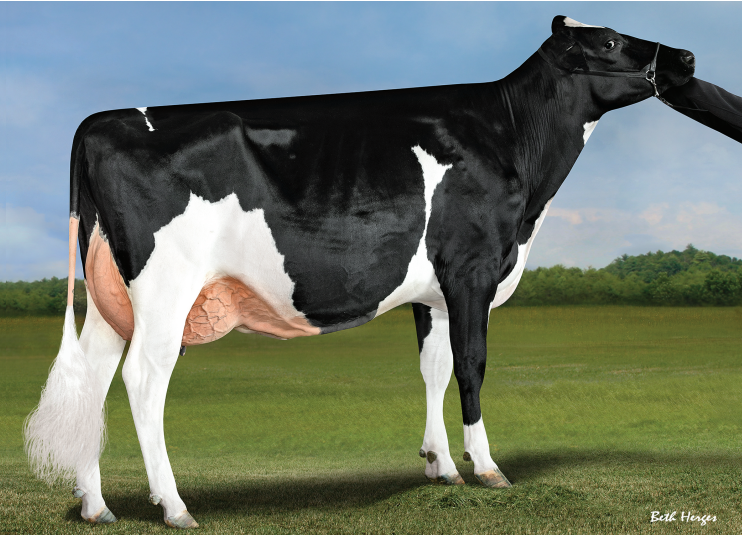
娘: ABS スペクター 7787 ET

父 牛 ウッドクレスト モーグル ヨダー ET 母 牛 デスー スーパーサイアー 3349 ET 2-01 3x365日 M 16,080kg 4.6% F 736kg 3.1% P 506kg 母の父 シーガルベイスーパーサイアー ET 祖母の父 ロングラングス オーマン オーマン ET