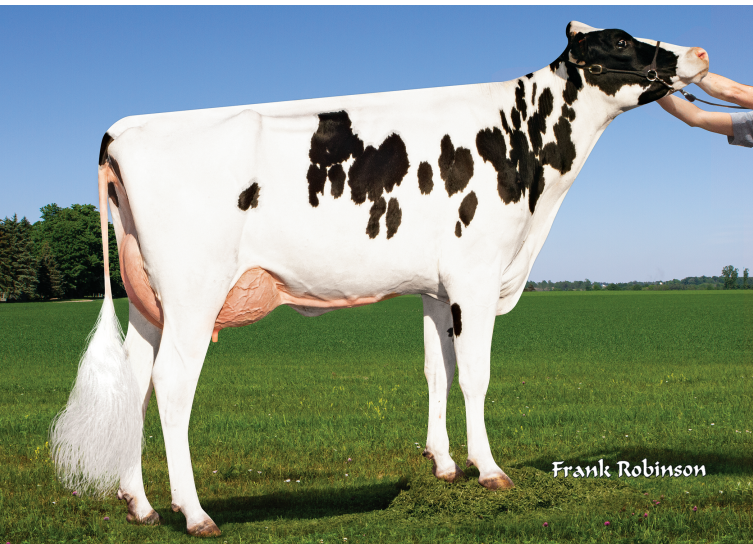
娘：パチェコ ブラントリー 7648種系

父 牛 パインツリー バーリー ET 母 牛 ウィルラ シルバー 939 ET 2-05 3x305日 M 14,111kg 4.0% F 566kg 3.0% P 423kg 母の父 シーガルベイ シルバー ET 祖母の父 シーガルベイ スーパーサイアー ET