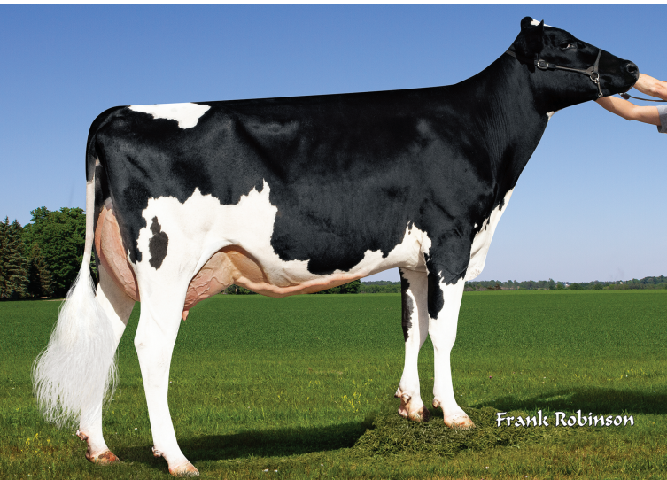
娘：ジョハン プロファウンド 39910種系

父 牛 トリプルクラウン JW マターズ ET 母 牛 デスー ジェダイ 5634 ET 3-02 3x365日 M 18,398kg 3.6% F 665kg 3.1% P 571kg 母の父 S-S-I モントロス ジェダイ ET 祖母の父 クッキーカッター ペトロン ハロゲン