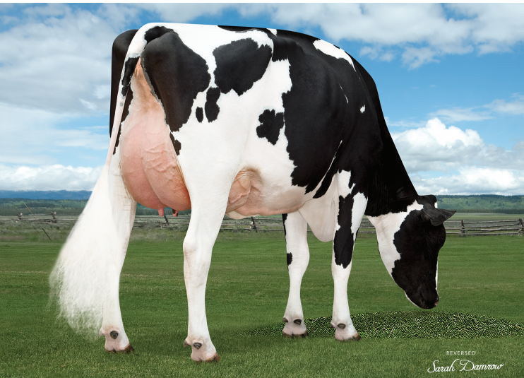
母: ウィンスター ウィンドフォール 4539 ET

父 牛 ウィンスター エッジ P ET 母 牛 ウィンスター ウィンドフォール 4539 ET 2-03 3x365日 M 14,883kg 4.1% F 616kg 3.3% P 496kg 母の父 バツヒル ウィンドフォール 54771 ET 祖母の父 ビューホーム パワーボール P ET