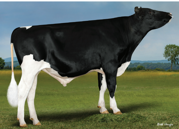
本牛: サンディーバレー スカymoon ET

父 牛 ウィンスター エルバーP ET 母 牛 サンディーバレー HJ スカイハイ ET 3-01 3x365日 M 17,563kg 4.7% F 833kg 3.5% P 619kg 母の父 AOT ハイジャンプ ET 祖母の父 パインツリー CW レガシー ET