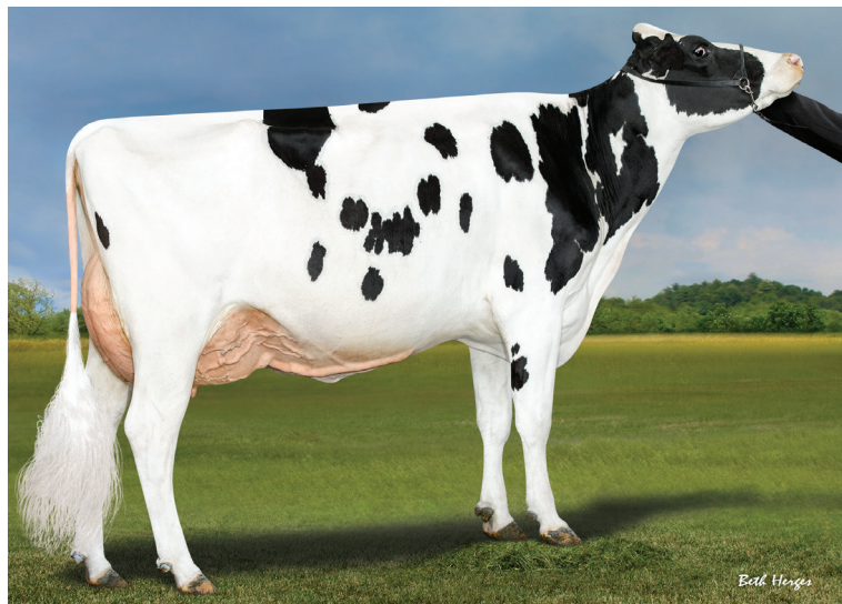
祖母：ボーマズ メドレー 8301

父 牛 ウィンスター オテズラ P ET 母 牛 ボーマズ ルーブルズ 9524 RED ET 2-02 3x305日 M 13,744kg 4.7% F 643kg 3.5% P 475kg 母の父 フージャーホースト DG OH ルーブルズ RED ET 祖母の父 ABS メドレー ET