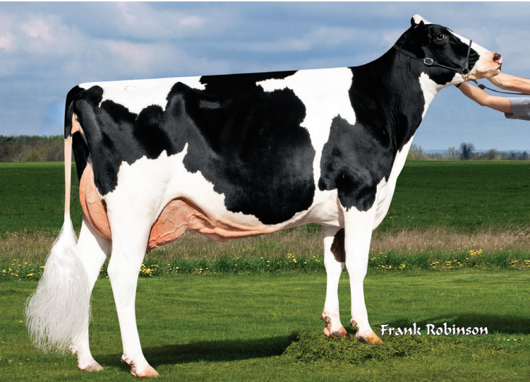
娘：カロリD セコヤ 9677種系

父 牛 MR モーグル デルタ 1427 ET 母 牛 シナジー スーパーサイアー ストラテジー ET 4-00 3x328日 M 17,509kg 3.8% F 662kg 3.2% P 557kg 母の父 シーガルベイ スーパーサイアー ET 祖母の父 ロングラングス オーマン オーマン ET