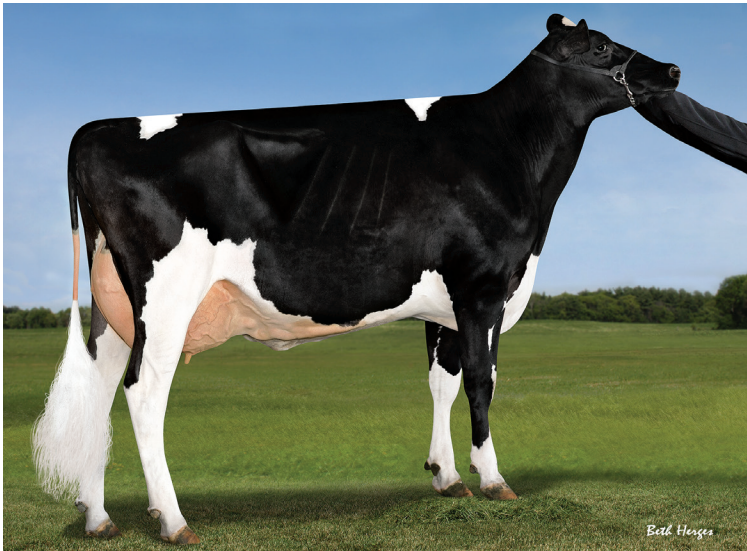
母：デスー デルタ 4900 ET