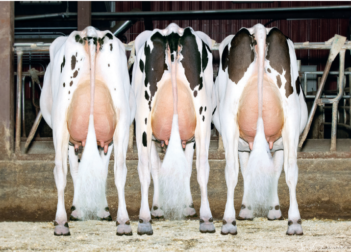
娘 Trio: (左) ウィンスター メンデル 7793 P ET (中央) ウィンスター メンデル 7804 P ET (右) ウィンスター メンデル P 2587 ET

父 牛 デノボ 8084 エンティティ ET 母 牛 ウィンスター ウィンドフォール 4539 ET 2-03 3x365日 M 14,883kg 4.1% F 616kg 3.3% P 496kg 母の父 バズビル ウィンドフォール 54771 ET 祖母の父 ビューホーム パワーボールP ET