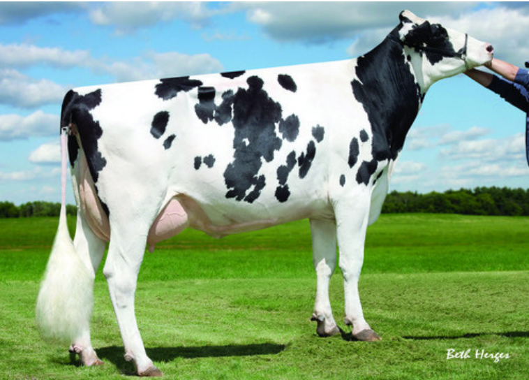
6代前の母：サリー ショットル メイ TW

父 牛 パインツリー アキュラ ET 母 牛 デノボ ヨーダ 8802 ET - x - 日 M - kg - % F - kg - % P - kg 母の父 キャロロイヤル ヨーダ ET 祖母の父 S-S-I ファーストクラス フラッグシップ ET