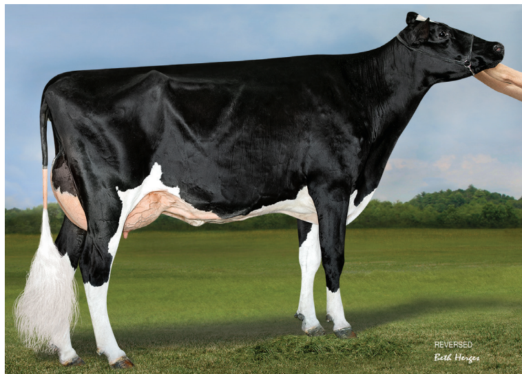
祖母：デスー フラズルド 6984 ET