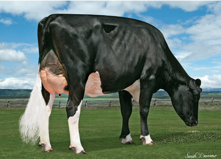
祖母：ウィンスタークリムゾン5742 ET

父 牛 デノボ 16970 スキート ET 母 牛 ウィンスター アキュラ 7357 ET - x - 日 M - kg - % F - kg - % P - kg 母の父 パイツリー アキュラ ET 祖母の父 ABS クリムゾン ET