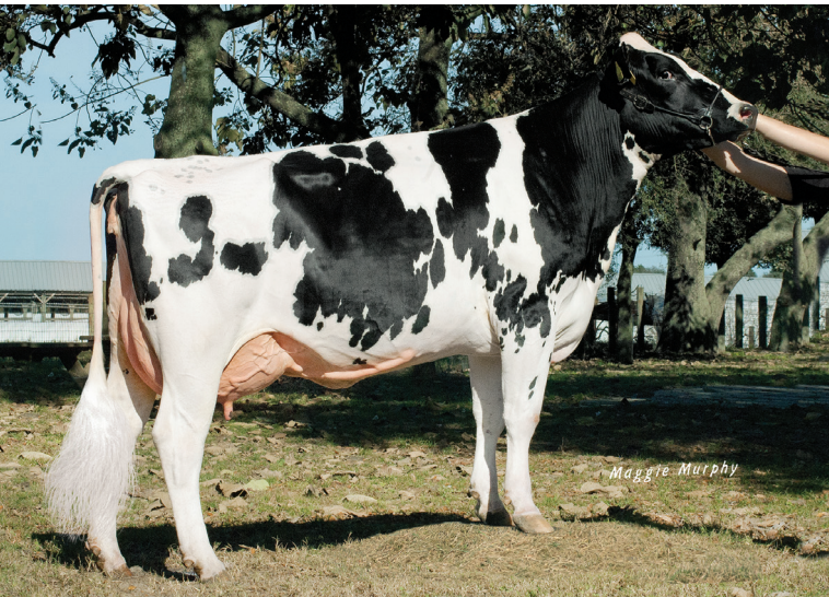
5代前の母: ノーフラ スーパーサイアー 36193 TW ET

父 牛 ウィンスター エクイティ P ET 母 牛 デノボ メイトリアーチ 2223 ET - x - 日 M - kg - % F - kg - % P - kg 母の父 ノーフラ メイトリアーチ 祖母の父 S-S-IPR レネゲード ET