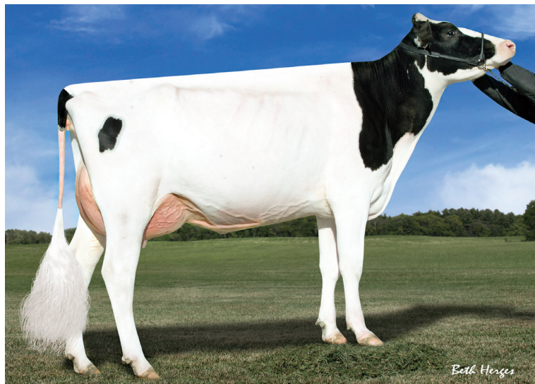
5代前の母：デスー Y-Gen プラネット シルク ET

父 牛 パインツリー ゴールデン ET 母 牛 デノボ モニュメント P 1607 ET