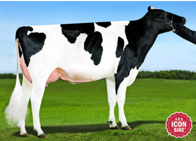
5代前の母: デスー モントロス 4011 ET

父 牛 LA-CA-DE-LE モンタナ ET 母 牛 デノボ ダフィー 3850 ET 2-02 3x288日 M 11,880kg 5.4% F 645kg 3.4% P 402kg 母の父 キングスランソム ダフィー ET 祖母の父 デノボ 15158 アドミラル ET