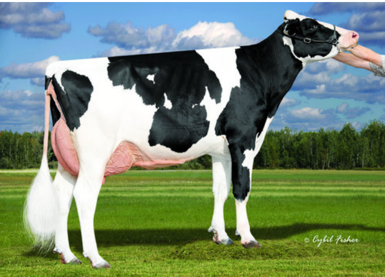
曾祖母: AOT ジャレット ハスケル ET

父 牛 デノボ 2776 リーズ ET 母 牛 デノボ メンデル P 16691 ET - x - 日 M - kg - % F - kg - % P - kg 母の父 ウィンスター メンデル P ET 祖母の父 パインツリー アキュラ ET