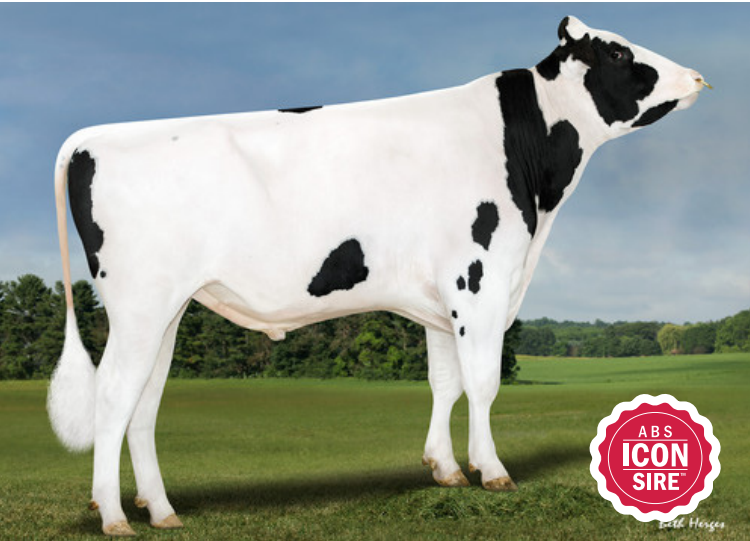
本牛：ボーマズ パロマ ET

父 牛 OCD トゥルーパー シープスター ET 母 牛 ボーマズ ゲームデイ 915 ET 2-10 3x356日 M 13,612kg 4.7% F 635kg 3.8% P 523kg 母の父 RMD ドットラー SSI ゲームデイ ET 祖母の父 ボーマズ アルタトップショット ET