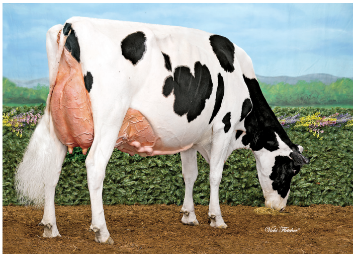
母：ウォルナットローン マッカチェン サマー ET

父 牛 ウッドクレスト キングドック 母 牛 ウォルナットローン マッカチェン サマー ET