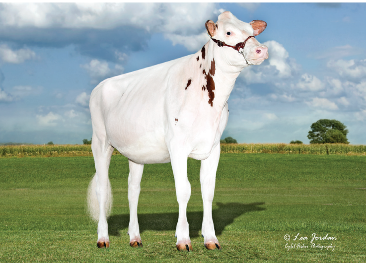
娘：ラース エーカース ショウタイム ショッツ レッド

父 牛 サンディーバレー KR エクスカリバー 母 牛 アルバクレス スナップル シャキーラ ET 4-11 2x365日 M 16,133kg 4.8% F 776kg 3.7% P 589kg 母の父 GS アライアンス O カリバー 祖母の父 ルックアウト P レッドバースト RED ET