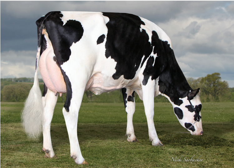
4代前の母: リッチモンドFD S バーバラ ET

父 牛 バジャー SSI ルシア ファーニカ ET 母 牛 ペンイングランド バーブ 16118 ET 3-10 3x365日 M 18,058kg 3.8% F 680kg 3.3% P 596kg 母の父 S-S-I PR レネゲード ET 祖母の父 メラリー ジョスパー フラズルド ET