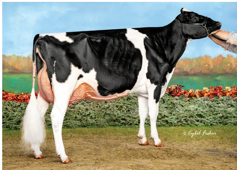
母: S-S-I ドック ハブ ノット 8783 ET